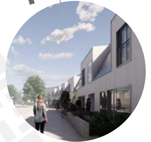
KATUTILOJEN INHIMILLINEN MITTAKAAVA JA PUOLIJULKISET KADULLE AVAUTUVAT SISÄÄNTULOPIHAT