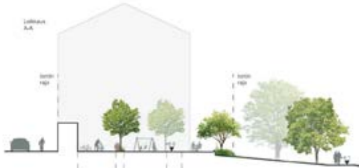
VEHREÄT YHTEISET PIHAT