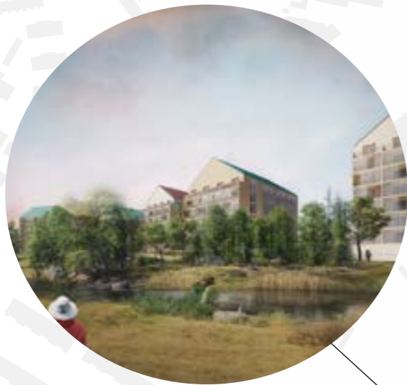
LUONNONMUKAISENA SÄILYVÄ JOKIVARSI

Tavoitteena on, että suunnittelualueella Espoonjoen varrelle muodostuu erilaisia vyöhykeitä. Suunnittelualueen itäosassa tavoitellaan kulttuurivaikutteista, avointa maisematilaa, jossa joki reunavyöhykkeineen rajautuu maisemapeltoon. Alueen keskiosassa on luonteeltaan rakennettua ympäristöä, jossa kuitenkin joki kulkee alueen läpi suhteellisen luonnonmukaisena. Länsiosassa jokea pitkin avautuu nykytilanteessa hienoja, kapeita näkymiä, joita halutaan korostaa tulevaisuudessa tilaa rajaavalla puustolla.