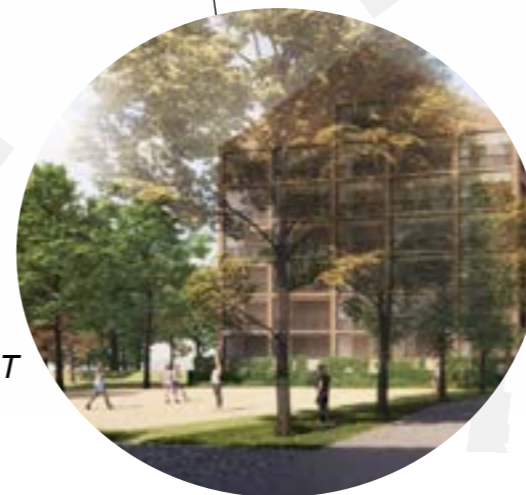
TOIMINNALLISET RAKENNETUMMAT PUISTON OSAT