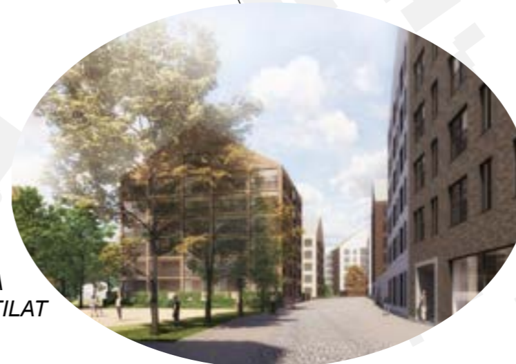
VAIHTOLEVAT NÄKYMÄT JA KIINNOSTAVAT KAUPUNKITILAT