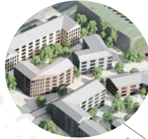
KÄVELTÄVYYS KORTTELIEEN LÄPI

Julkisivuilta edellytetään monimuotoisuutta, ja maantasokerroksia tulee aukottaa ikkunoin ja kulkuaukoin. Lisäksi rakennusten sisäänkäyntejä ja niiden ympäristöä on korostettava arkkitehtuurin keinoin, ja julkisivujen pienimittakaavaisuutta tulee korostaa sisäänvetojen ja ulokkeiden avulla maantasokerroksissa. Uusien rakennusten maantasokerrokset ovat aktiivisia, ja vaihtelevat katunäkymät tuovat ympäristöön yllätyksellisyyttä. Alueelle sijoituvien pysäköintitalojen julkisivujen on oltava kaupunkikuvallisesti korkeatasoisia - myös niiden maantasokerroksen julkisivukäsittelyssä on huomioitava jalankulkutason mittakaava, materiaalintuntu, viihtyisyys ja valaistus.