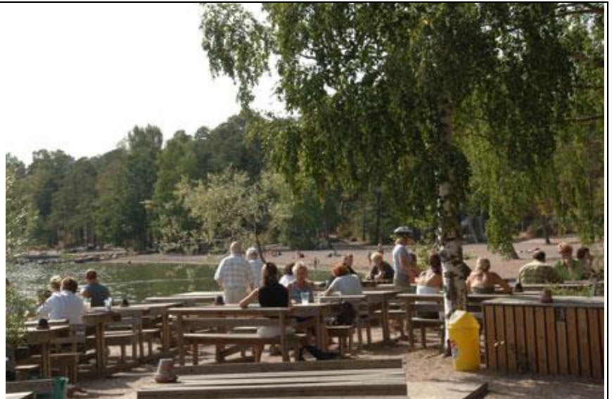
Näkymä kesäravintolasta uimarannalle