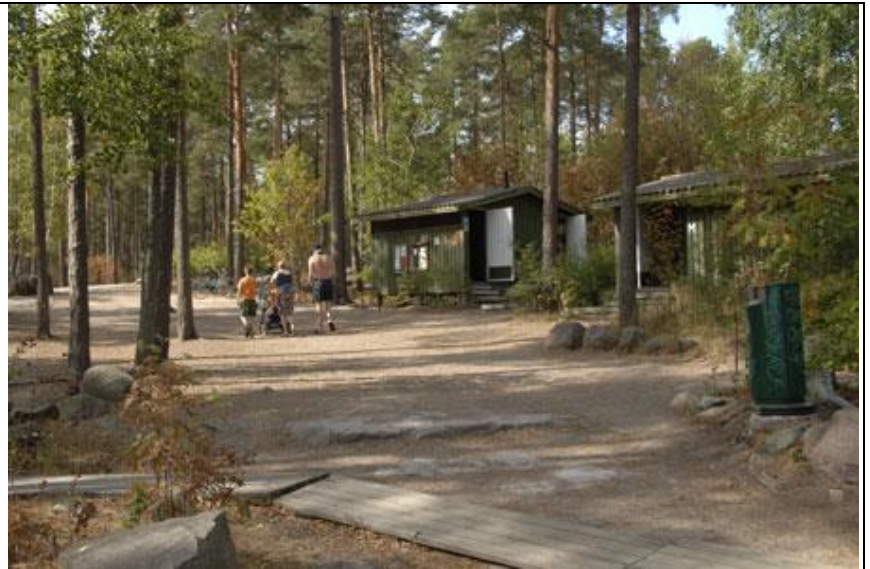
Pukuhuoneet ja wc:t