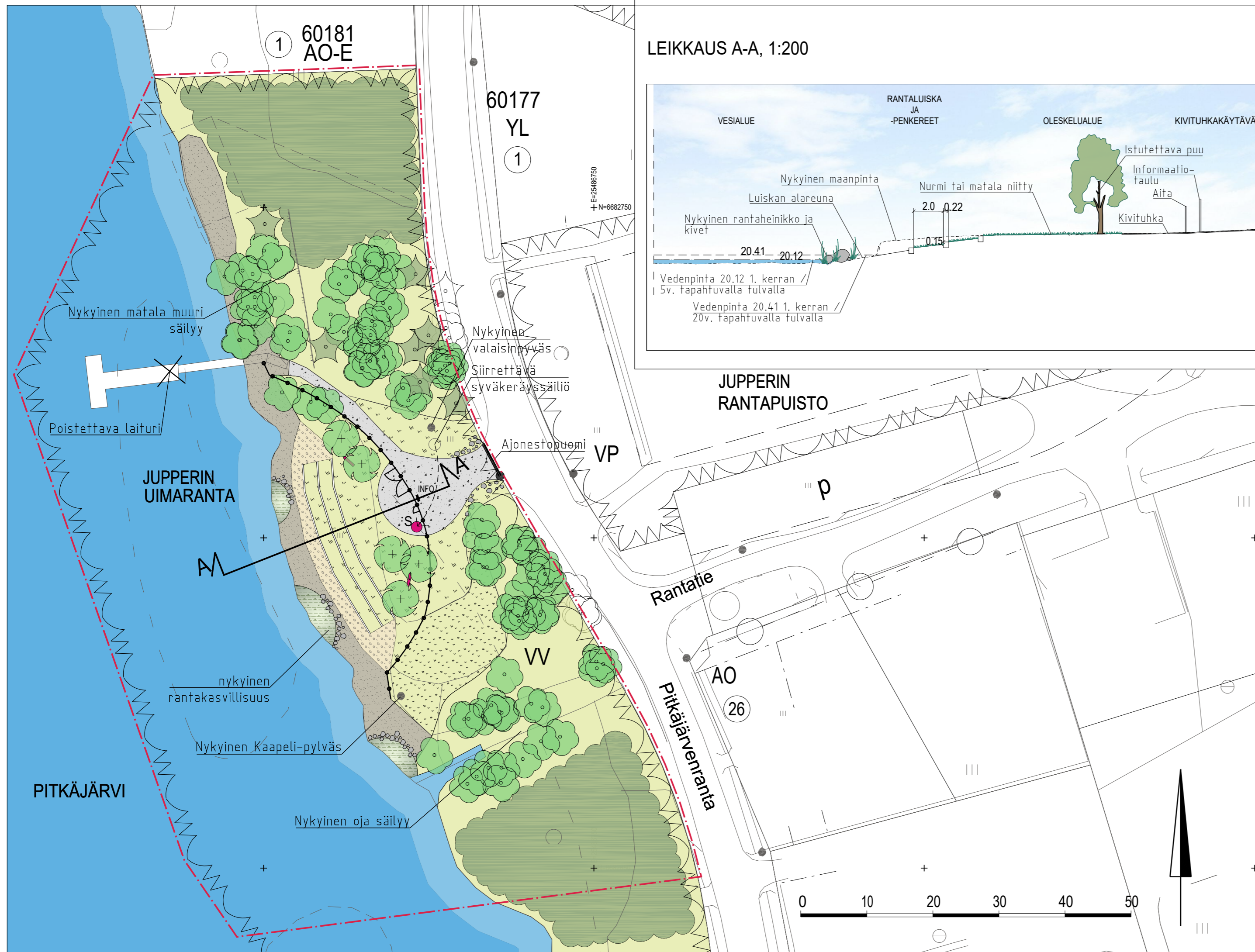
LEIKKAUS A-A, 1:200