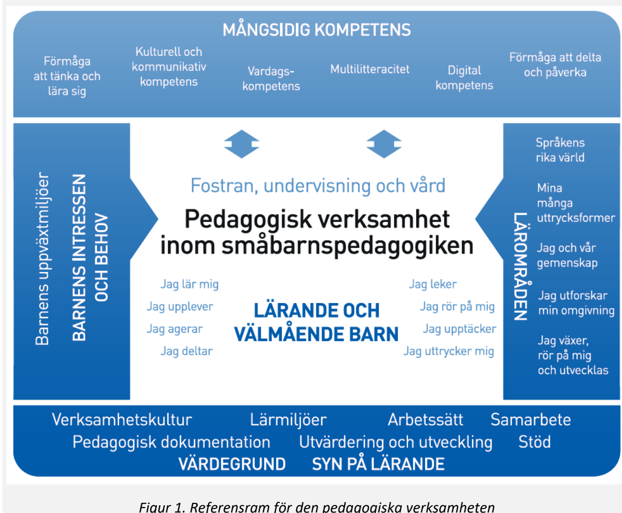
Figur 1. Referensram för den pedagogiska verksamheten

Den pedagogiska verksamheten inom småbarnspedagogiken ska präglas av ett helhetsskapande angreppssätt. Målet är att främja barnens lärande och välbefinnande samt mångsidiga kompetens (figur 1). Den pedagogiska verksamheten förverkligas i samverkan mellan barnen och personalen och i den gemensamma verksamheten. Barnens spontana verksamhet, personalens och barnens gemensamma idéer till verksamhet och verksamhet som planerats av personalen ska komplettera varandra. Den pedagogiska verksamheten inom småbarnspedagogiken ska genomsyra den helhet som består av fostran, undervisning och vård.