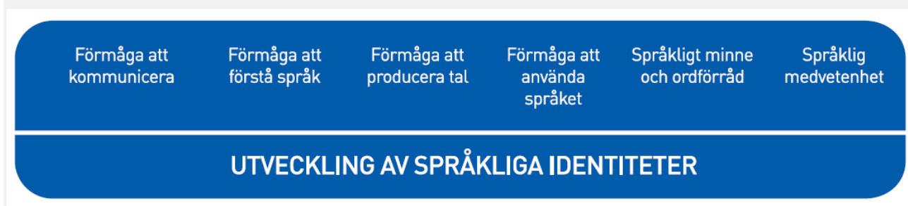
Figur 2. Språkutvecklingens centrala delområden inom småbarnspedagogiken

Med tanke på språkinläringen är det viktigt att vara medveten om att barn i samma ålder kan befinna sig i olika skeden av språkutvecklingen inom olika delområden. De språkliga identiteterna utvecklas när barnen får stöd och handledning inom de centrala delområdena för språkliga kunskaper och färdigheter.