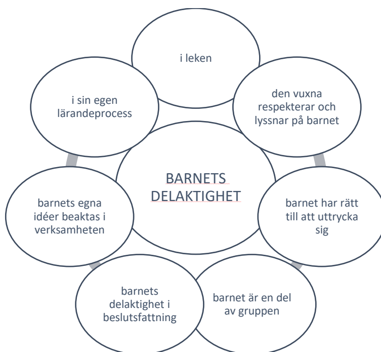
Bild 3 Delaktighet i småbarnspedagogiken

Barnens tidigare erfarenheter, intressen och idéer är utgångspunkten då verksamheten planeras. Personalens ansvar är att beakta att alla barn är delaktiga och har möjlighet att påverka frågor som gäller dem och verksamheten. Inom givna ramar ges barnet möjlighet att göra egna val och uppleva vad det innebär att vara delaktig i gemensamt beslutsfattande. Genom att främja delaktighet i verksamheten övar barnet sig på att lyssna och samarbeta med andra, kompromissa och ta hänsyn till andra. Att upptäcka att den egna åsikten är viktig är centralt för barnets känsla av delaktighet. Att barnet har en känsla av delaktighet innebär också att barnet blir bekräftat och känner sig inkluderad i gemenskapen.