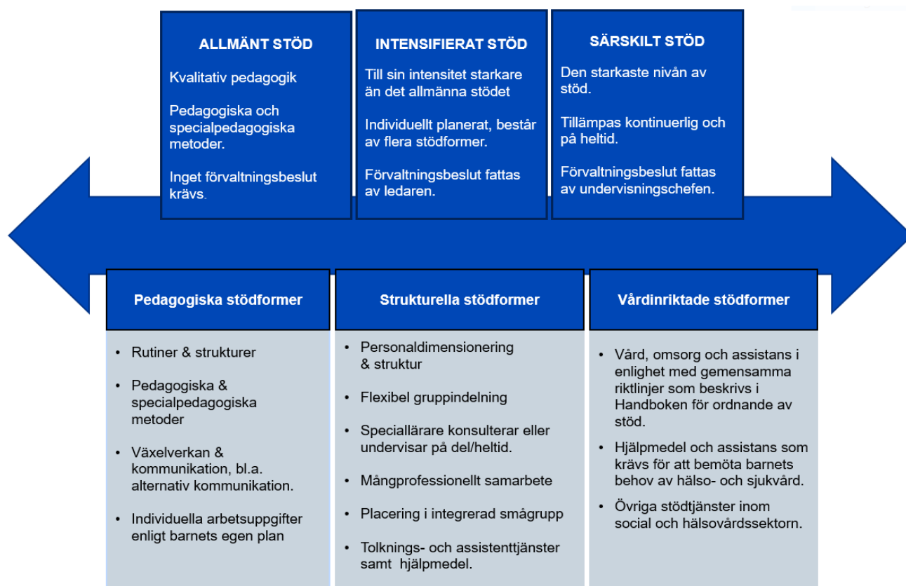
Figur 3. Översikt över stödnivåer och stödformer inom småbarnspedagogiken