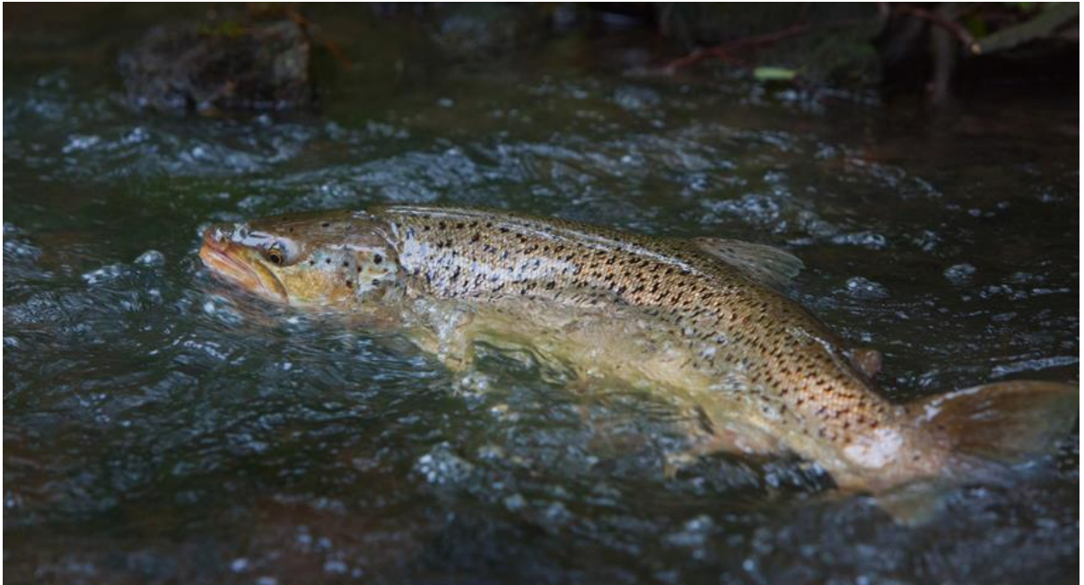
Kuva: Haagan puron taimen, Henrik Kettunen/Vaelluskala ry